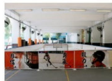
仁愛堂田家炳小學是全港首間學校設「仿真溜冰場」。