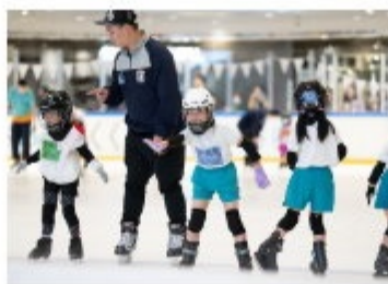
幼稚園學生參與冰運會的溜冰體驗。